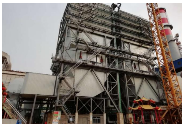
迁钢公司 360 平烧结机深度治理改造