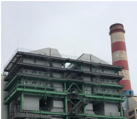
京唐公司烧结烟气脱硫脱硝

京唐公司烧结脱硫脱硝超低排放深度改造项目克服了大型烧结机超低排放无先例、技术难度大、工程量大、施工困难等难题，采用“半干法循环流化床脱硫+SCR脱硝”工艺对烟气进行深度处理，烟粉尘、二氧化硫、氮氧化物排放浓度稳定达到超低排放标准10、35、50mg/Nm 3 ，进一步降低了污染物排放。