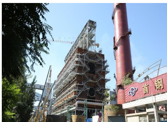
迁钢公司球团二系列脱硫脱硝系统

按政府部门要求，迁钢公司积极开展限期治理项目建设，3 座高炉炉顶均压放散全回收项目，解决了钢铁行业均压放散回收第一难题，高炉煤气彻底回收。对炼铁部原料系统除尘进行滤料材质升级，更换为高效滤筒，在不改变除尘器箱体结构的基础上，扩大过滤面积 30%以上，有效降低过滤风速，使出口浓度完全达到超低排放标准；炼铁部、炼钢部环境除尘改造后颗粒物排放浓度低于 10 毫克/立方米。2018 年 9 月 28 日，唐山市环保局组织对完成超低排放标准项目进行了验收，经专家评审，一致同意通过验收。