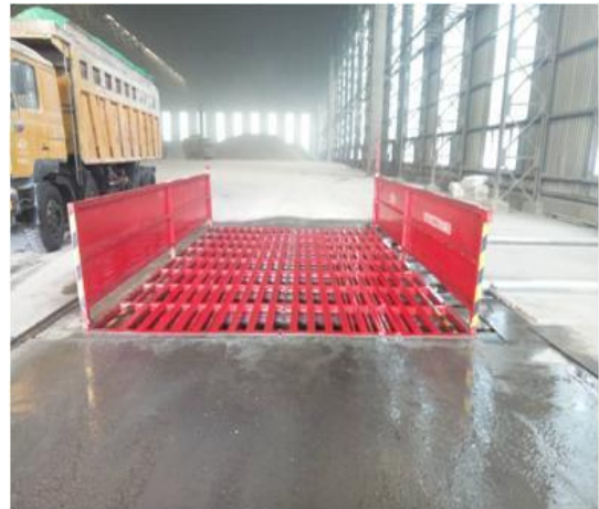
京唐公司供料部灰石料场洗车台

冷轧公司在2018年以来共投资2600万元，与比利时DREV ER公司合作，对冷轧公司三座热处理炉生产历史数据进行综合分析和充分论证后，采用燃烧系统优化与烟气脱硝复合减排技术方案进行改造，工期短，无需额外增加场地，且运行费用低，具有很强的适用性。经过周密部署，合理安排工期，精心调试运行，改造后的热处理炉的氮氧化物排放浓度稳定在80mg/m 3 以下。